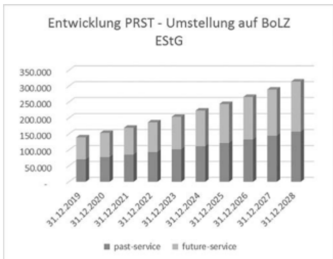
Abb. 3: Umstellung BoLZ auf EStG

heit bei der Bestandszusage nach der PUC-Methode (degressives m/n-tel Verfahren) bewertet.